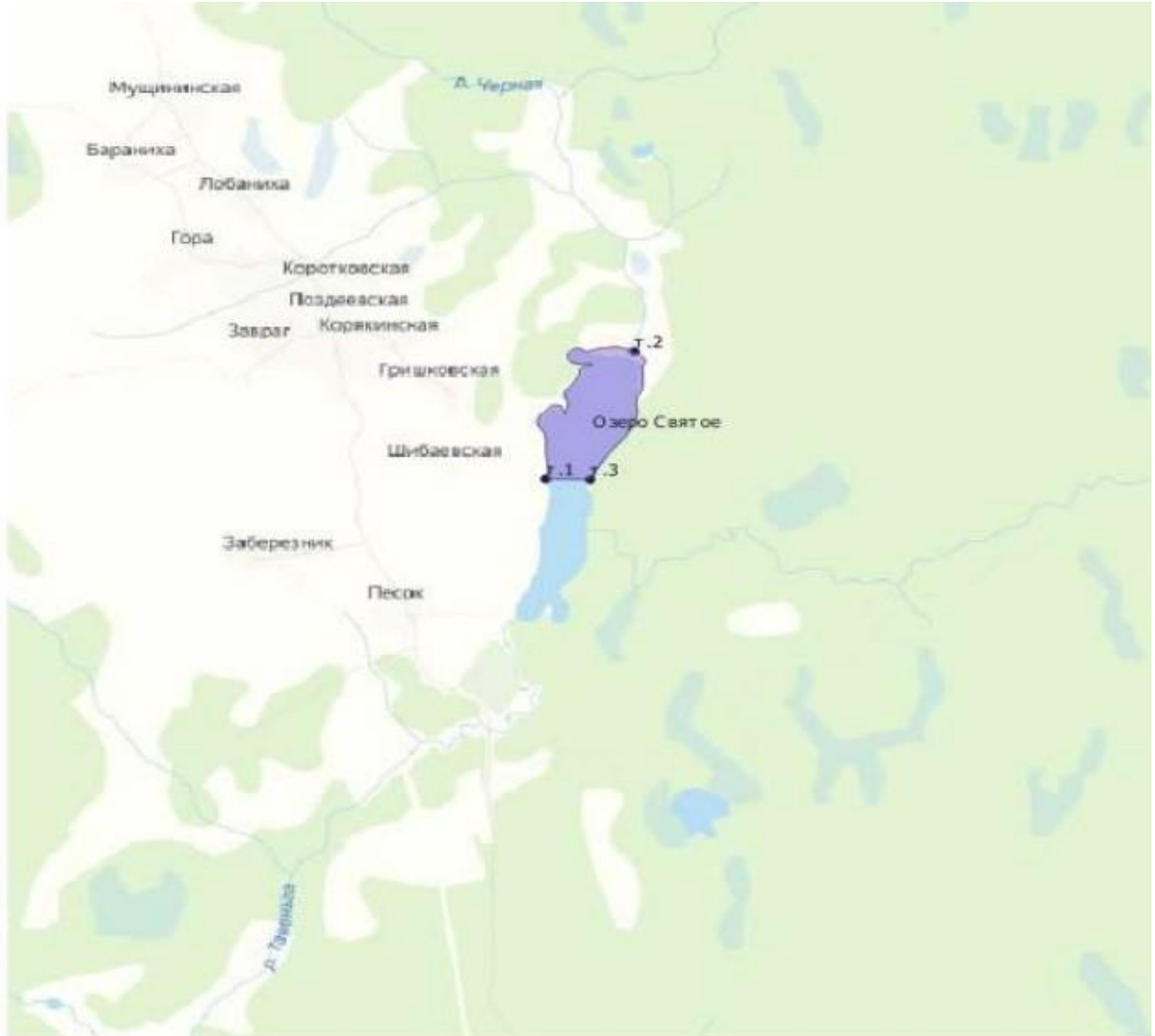
Схема водного объекта с границами рыбоводного участка