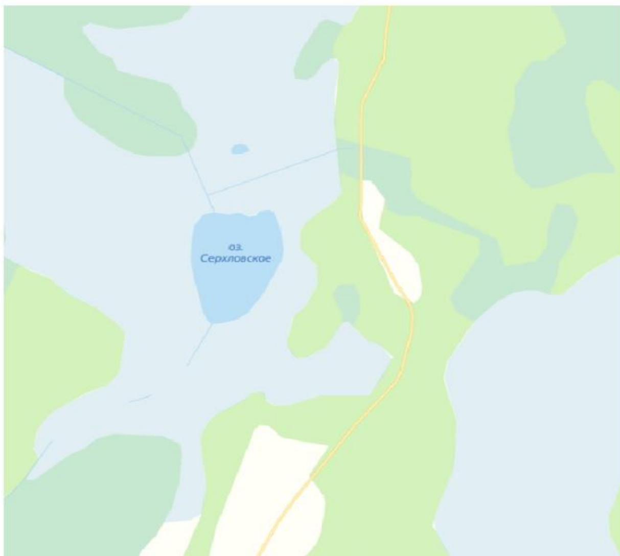
Вологодская область, Бабаевский муниципальный округ, озеро Серхловское, вся акватория водного объекта